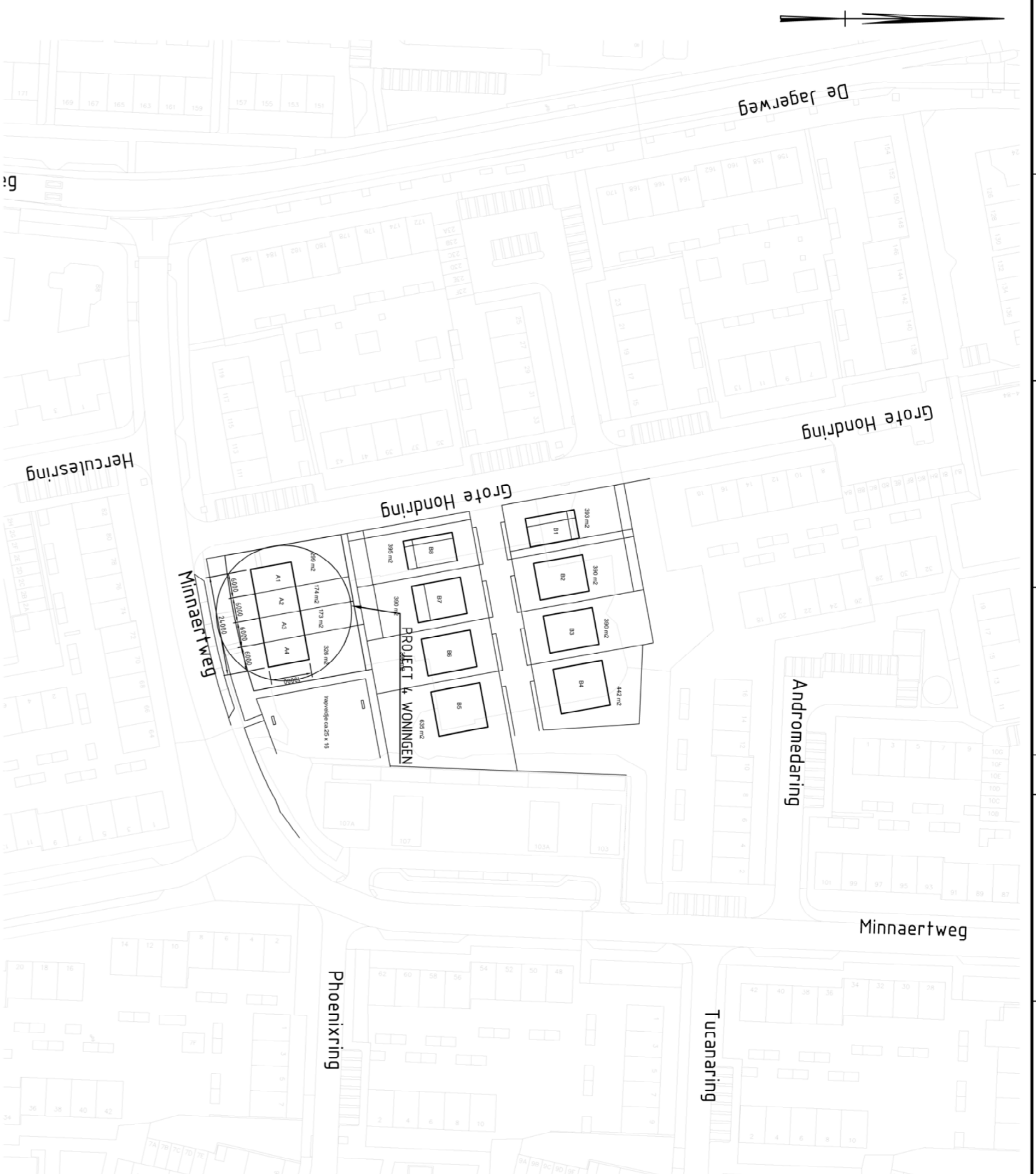
Overzicht Situatie SCHAAL 1 : 1000